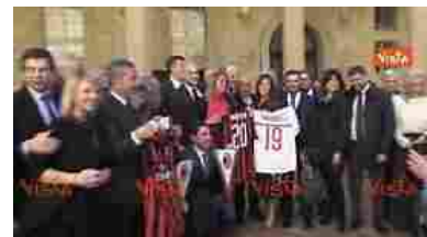
La foto di gruppo del Milan Club Parlamento, e c'è anche qualche coro da stadio