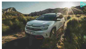
Citroën C5 Aircross

Tuo con anticipo 0, da € 299 al mese. TAN 3,99% - TAEG 5,06%. Sabato 16 e domenica 17.