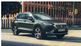
Nuova SEAT Tarraco.

Tua da 199€ al mese, il grande SUV di SEAT anche a 7 posti. TAN 3,99% - TAEG 4,98%.